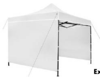
Express 3m x 3 m